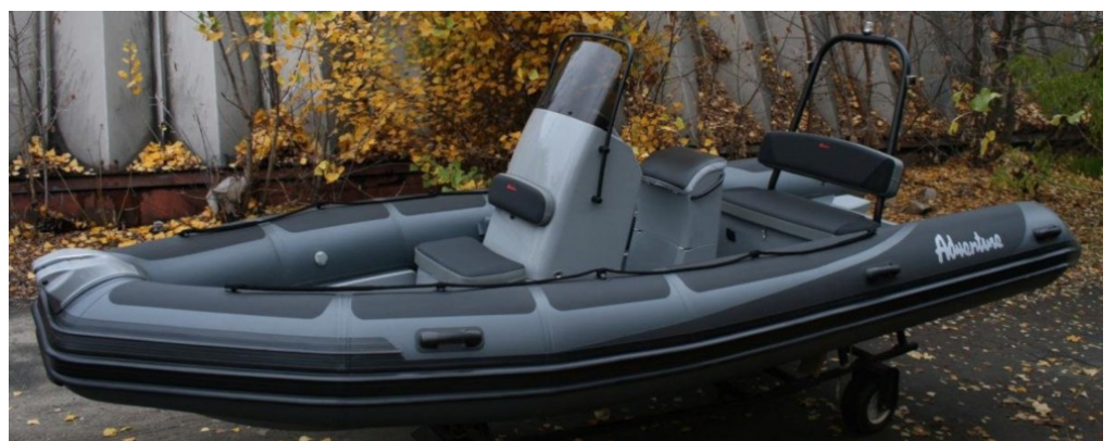
Vesta 585 HD