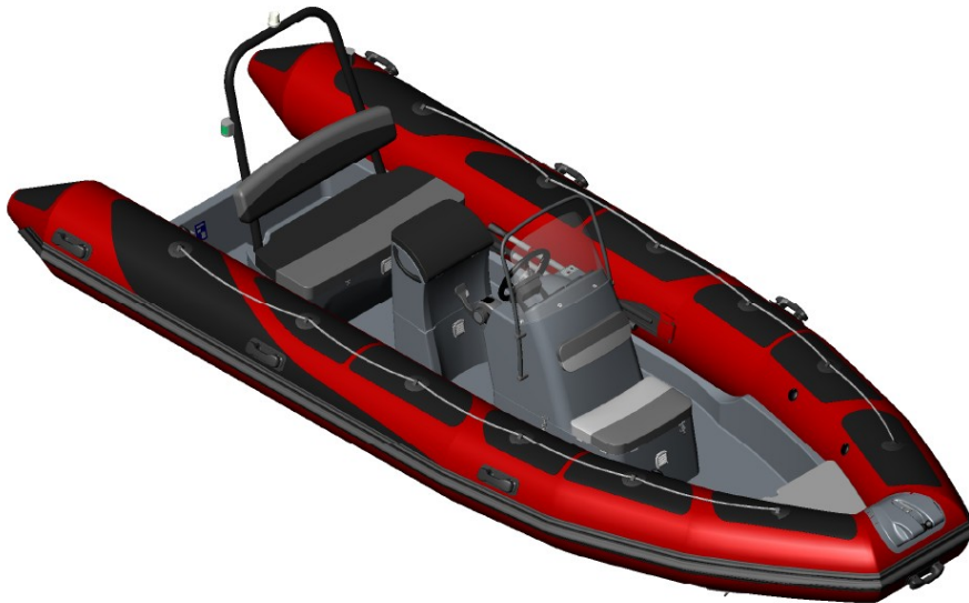
Vesta 585 HD