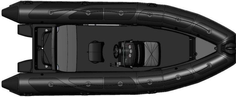
Vesta 585 HD